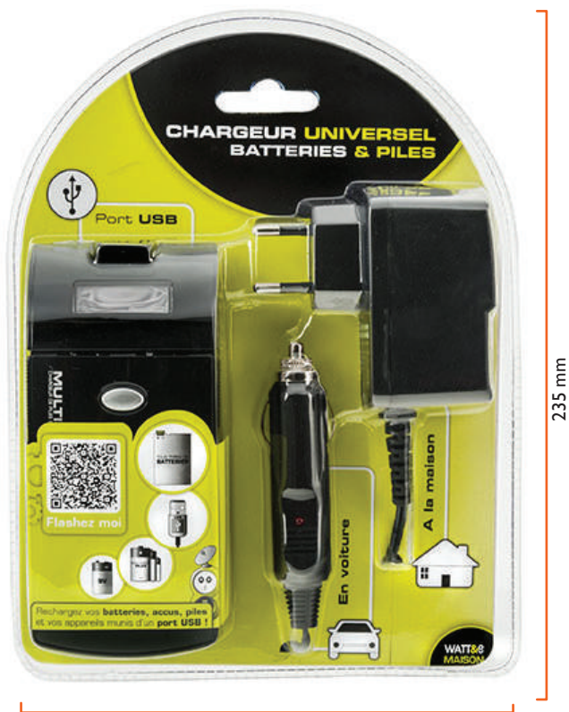
180 mm Chargeur universel de piles, batteries et smartphones