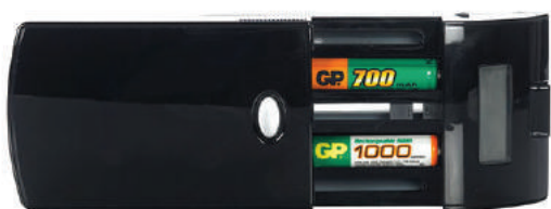
Piles / Accus