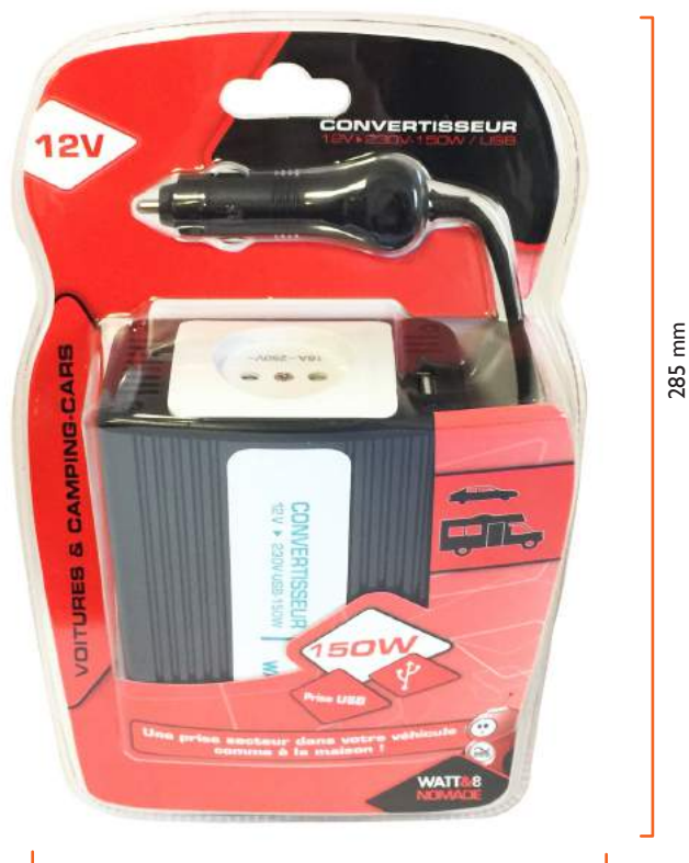
Convertisseur 12V -220V 150W Inverter 12V-220V 150W

Conditionnement - Packaging .....Blister Composition de l'emballage - Packaging material ..... Papier, carton, plastique dont recyclé / Paper, card and plastic including recycled paper Langues sur l'emballage - Packaging languages .....FR Éco-conçu - Eco-design .....Oui / Yes Éco-organisme - Eco-organisation .....Ecologic