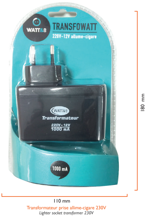
110 mm 180 mm Transformateur prise allume-cigare 230V Lighter socket transformer 230V